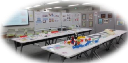
センターの子ども達の力作が揃い、熱心にご覧いただきました

2020年1月31日、2月1日に開催した「パネル展示・個別相談 幼児期からはじめる自閉症の療育～将来に向けたファーストステップ～」には、多くの皆様にご来場いただきありがとうございました。また、作品の展示にご協力いただいたお子さんとご家族の皆様にも深謝いたします。今後も様々な形でお子さんたちの将来の可能性に向けて発信していきたいと思っております。どうぞよろしくお願いいたします。