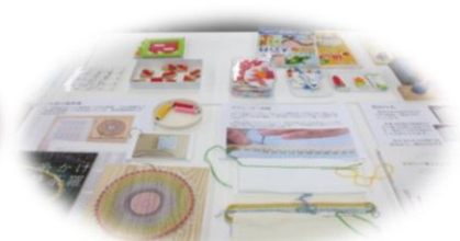
直接教材に触れられる体験コーナーも人気でした