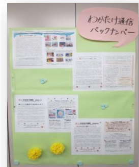
わかたけ通信バックナンバーもご好評いただきました

色々な行動が身につく前の幼児期は大変なことが多いですが、やりとりの基本となる態度と姿勢を身につけていくと、周りの人からのサポートを上手く受けられるようになっていきます。持っている力を発揮することやもっともっと力を伸ばしていくためには、「待つこと」「注意を向けること」「観察すること」... 何よりも「ほめられながら繰り返し取り組むこと」これらを身につけることが大事です。そして、それは「人」が教えるしかありません。その積み重ねの結果が力作なのだと思います。