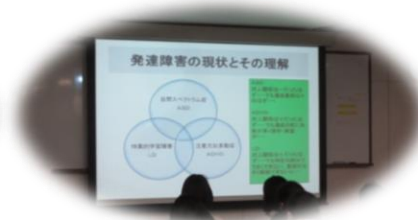
プレゼンテーションにも多くの方にご参加いただきました